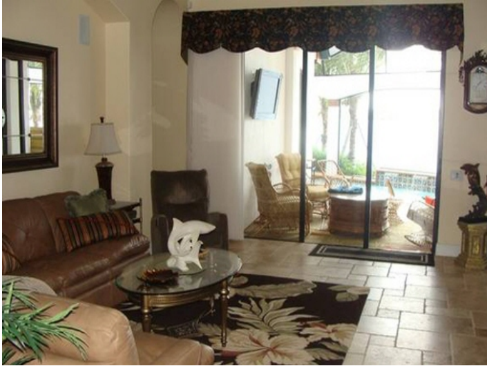
Salón hermoso con terraza y centro multimedia en Fort Myers