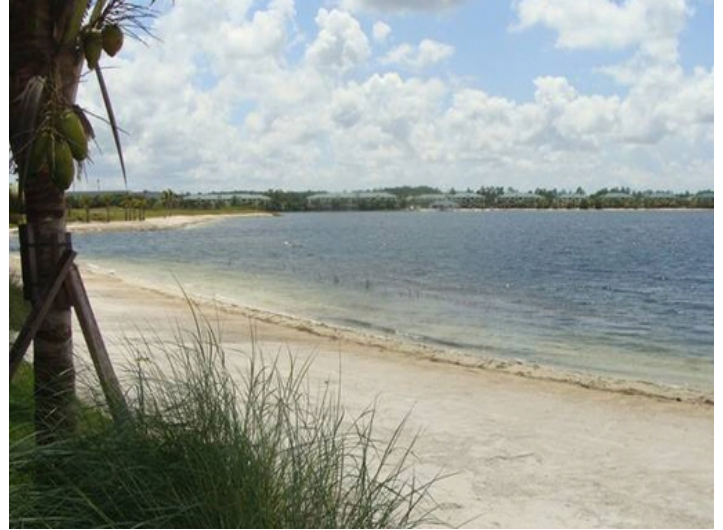
Idyllic views of the surrounding terrain in Fort Myers