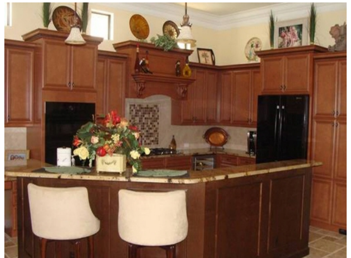
Cocina familiar con barra Americana en Fort Myers