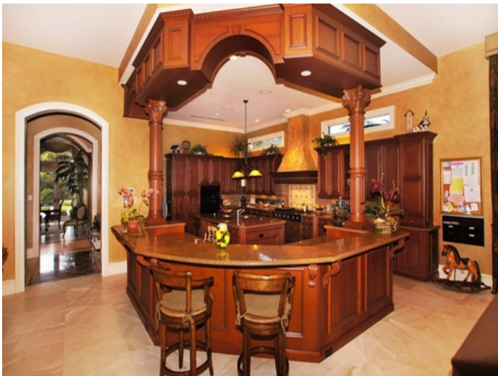
Cómoda cocina con barra