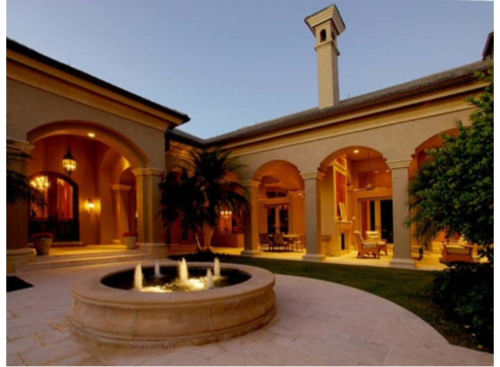
Fuente dentro de la propiedad