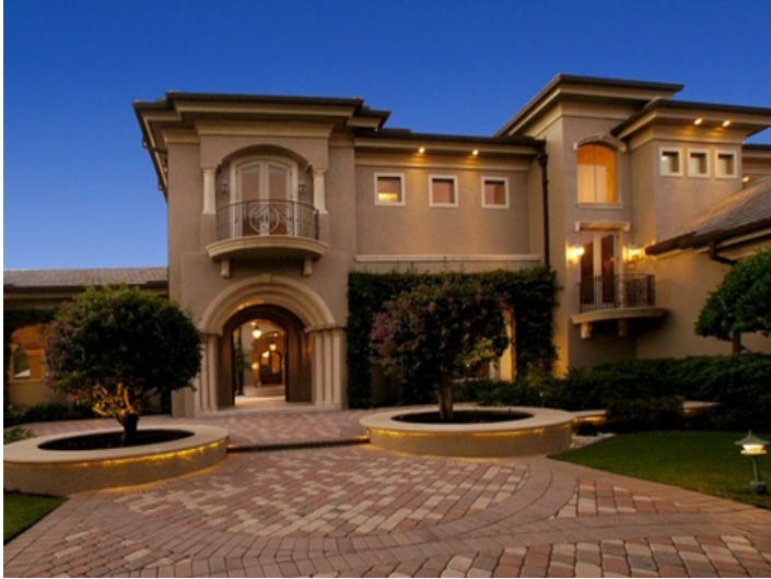
Entrada a la villa