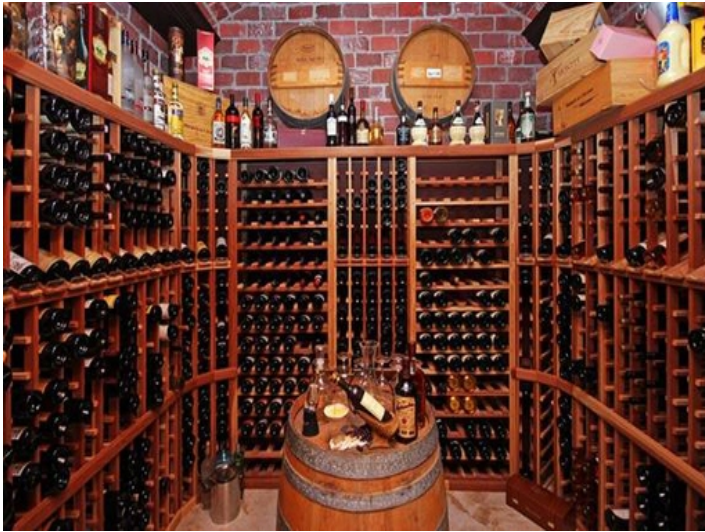
Bodega difícil de encontrar