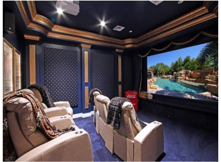
Sala de cine privada