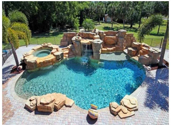
Piscina cautivadora en la terraza