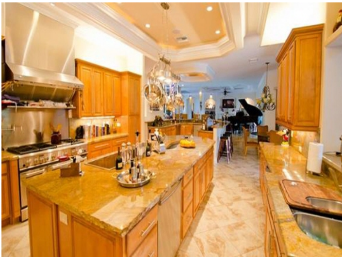
Cocina totalmente integrada